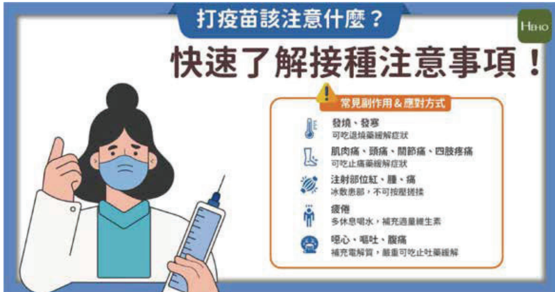
圖二 打疫苗該注意什麼？

師處方後給予進一步處置或藥物治療。除常見外，所謂罕見( \geq 1/10,000 至 < 1/1,000 )、極罕見( < 1/10,000 )不良反應也可能出現。(以上摘錄自「COVID-19疫苗系列專欄：接種後常見的不良反應有哪些？」，鄔豪欣 / 疾病管制署感染管制及生物安全組，疫情報導第37卷第11期，2021年6月8日。) 疾病管制署設置「疫苗不良事件通報系統 (VAERS)」。Q：什麼是疫苗不良事件(vaccine adverse event, VAE)？A：疫苗不良事件就是預防接種後不良事件(adverse event following immunization, AEFI)。指的是接種疫苗者在接種疫苗之後任何時間所出現任何身體上的不良情況。這些事件發生在疫苗接種之後，但不代表就是接種疫苗造成。(參考「疫苗不良事件通報原則